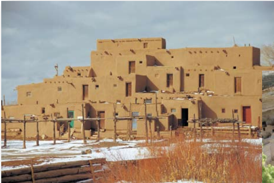
Taos Pueblo New Mexico