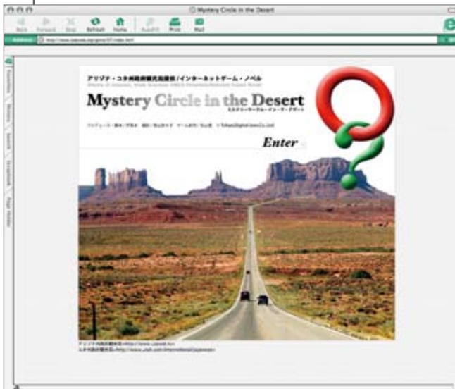
↑ 前回のゲーム『Mystery Circle in the Desert』のTOPページ。

→ 協力スポンサーをストーリーに組み込んだ画面。 ダイヤモンドビッグ社『地球の歩き方』と、 ノースウエスト航空の例。