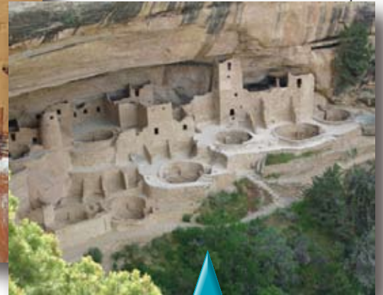
Mesa Verde Colorado