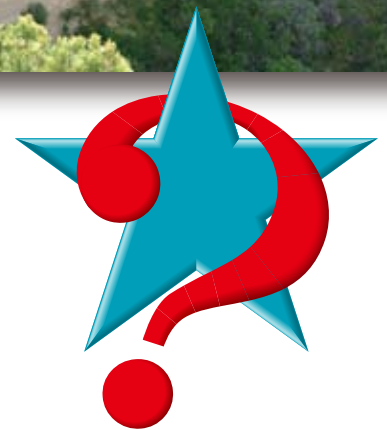
Carlsbad Caverns National Park New Mexico

協賛スポンサーの製品、あるいは業務内容をゲームの中のストーリーで積極的に取り入れることにより、ごく自然に企業の長所をアピールすることができます。またゲームの謎解きに絡むことで、ユーザーの深い関心を引き起こし、通常の広告では得られない、潜在意識に働きかける効果を見込めます。